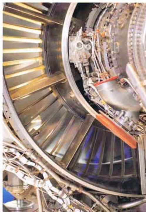
Mit einer pulsierenden anstelle einer kontinuierlichen Kühlung lässt sich das Stoßwellenverhalten beeinflussen – die Stoßintensität sinkt um bis zu 70 Prozent. Das fanden Forscher mit Hilfe eines additiv gefertigten Modells heraus.

Die auf diese Weise hergestellte Turbinenschaufel ist zudem so ausgelegt, dass sich mit ihr eine Vielzahl von Messungen durchführen lässt. Dabei sei sichergestellt, erläutert De Bruyne, dass weder Sensoren noch die Verkabelung die Windkanalexperimente beeinflussen. Dank der Windkanaltests konnten die Forscher die Aerodynamik besser verstehen. Laut Paniagua fand man heraus, dass sich mit einer pulsierenden Kühlung das Stoßwellenverhalten beeinflussen lässt – die Stoßintensität sinkt um bis zu 70 Prozent. „Dies erschließt